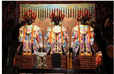
圖 8：臺南市祀典大天后宮註生娘娘

臺灣媽祖信仰盛行，經常以註生娘娘為配祀神。舉其例一，如：臺南市祀典大天后宮同時標示「臨水夫人」與「註生娘娘」（圖 8），亦即該宮「註生娘娘」就是由臨水夫人擔任。神尊有三，即陳、林、李三位夫人，其下「註生娘娘」神牌之左右脅侍為花公、花婆。