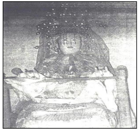
圖 2：臨水夫人神像 40