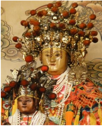
圖 6：臺北市大龍峒保安宮註生娘娘

關網站訊息寫著：「有謂臨水夫人陳靖姑，或女媧娘娘」， 74 但筆者認為祂們不似陳、林、李三奶夫人，而看似雲霄、碧霄、瓊霄三仙（圖 7）。