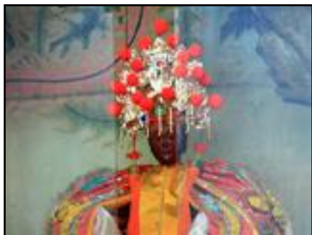
圖 4：高雄市註生宮主神註生娘娘 68

陰山縣林姓千金，名曰林照雪，一生持齋，專為梓里助生，照料孤寡，代人作嫁，解決困難，距今 1026 年，前一生修為尚不足，再二次出生，補其不足，而後成神，執掌 註生 ，宋朝太祖趙匡胤，因其功完果滿，而歸證果成神，經瑤池金母敕封為註生娘娘，執掌註生祐民，而受人間萬代香煙。」 67