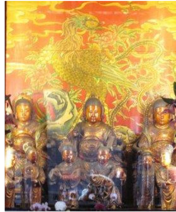
圖 7：臺北市萬華區龍山寺註生娘娘

臺灣媽祖信仰盛行，經常以註生娘娘為配祀神。舉其例一，如：臺南市祀典大天后宮同時標示「臨水夫人」與「註生娘娘」（圖 8），亦即該宮「註生娘娘」就是由臨水夫人擔任。神尊有三，即陳、林、李三位夫人，其下「註生娘娘」神牌之左右脅侍為花公、花婆。