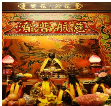
圖 14：宜蘭市南興廟花、公花婆