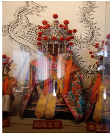
圖 5：臺南市臺灣府城隍廟註生娘娘

據載：「我國明末，內正紛亂，盜賊四起，民不聊生。福建泉州地方，有一位舉人，姓趙，家財萬貫，單生一女，命名貞娘；年二八時，長得亭亭玉立，有落雁沈魚之貌。往趙家求婚者，絡繹於途；趙舉人心想其女，琴棋詩畫，件件精通，應該物色一位泉州有名的才子，方能稱得上是郎才女貌；便和一位姓張的士子訂婚，花燭未到，其婿卻在一次結伴遊山的時候，被強人殺