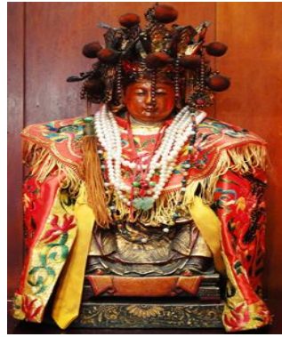
圖 14: 大龍峒保安宮池頭夫人

據傳，昔日艋舺（萬華）有頂、下郊械鬥之紛爭，清咸豐三年（1853），當時艋舺商業正興，卻發生頂郊與下郊人因碼頭力伕口角及商業利益大械鬥，俗稱「頂下郊拼」，戰禍波及大龍峒。某日頂郊人進擊，為龍山寺池邊之孕婦所發現、示警，下郊人才得保全領域。由於被頂郊人所殺，下郊人感念其德，祀奉為池頭夫人，祀典於神誕之農曆三月六日。