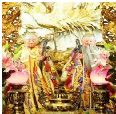
圖 13：臺南市臨水夫人媽廟花公、花婆

註生娘娘的從祀神往往視情況而定，在廟宇的空間擺設裡，主祀臨水夫人的宮廟，通常配祀花公、花婆，例如：臺南市祀典大天后宮註生娘娘之從祀花公、花婆；臨水夫人媽廟有花公、花婆（圖 13）和三十六婆姐；宜蘭市南興廟的「慈航普濟」四字下為觀音菩薩，再下之平臺有花公、花婆（圖 14）。一些以註生娘娘為陪祀或同祀神的廟宇，有的簡化為十二婆姐，如：臺北市大龍峒保安宮十二婆姐（圖 15）；或簡化成左右兩位手抱著幼兒的婆姐，如：臺東市大天后宮的婆姐。有些廟宇如：萬華龍山寺、大龍峒保安宮還有池頭夫人為陪祀，在此分項敘述之。