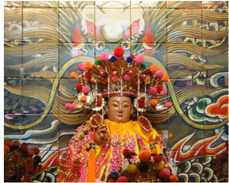
圖 12：宜蘭市南興廟註生娘娘

在臺南市臨水夫人媽廟裡，主神臨水夫人，配祀有註生娘娘。換句話說，兩者在此廟是完全不同的神。此一註生娘娘也是鳳冠霞帔的后妃造型，而且右手執筆，左手捧著一本生死簿。與之造型類似的，如：臺中市水安宮 78 、屏東茶山福德宮 79 、新北市三芝玉仙宮 80 以及宜蘭市南興廟的註生娘娘，相貌端莊高雅（圖12）。