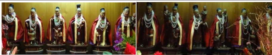
圖 15：臺北市大龍峒保安宮十二婆姐